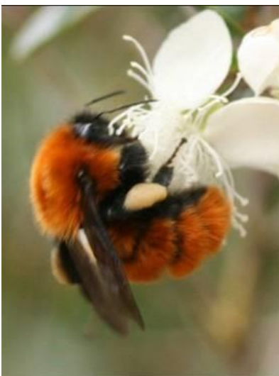
Abejorro Gigante de la Patagonia