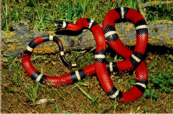
Serpiente Falsa Coral