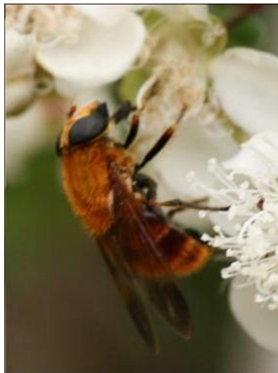
Mosca de las Flores